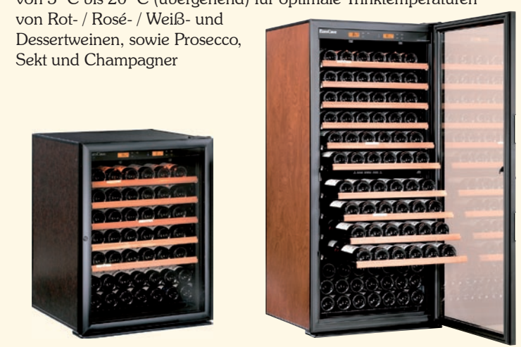
S - 083 Multitemperatur Weinklimaschrank Kapazität 92 Flaschen H 876 x B 654 x T 689 mm S - 183 Multitemperatur Weinklimaschrank Kapazität 183 Flaschen H 1.444 x B 654 x T 689 mm

Bietet automatisch geregelt konstante Klimabereiche von 5° C bis 20° C (übergehend) für optimale Trinktemperaturen von Rot- / Rosé- / Weiß- und Dessertweinen, sowie Prosecco, Sekt und Champagner