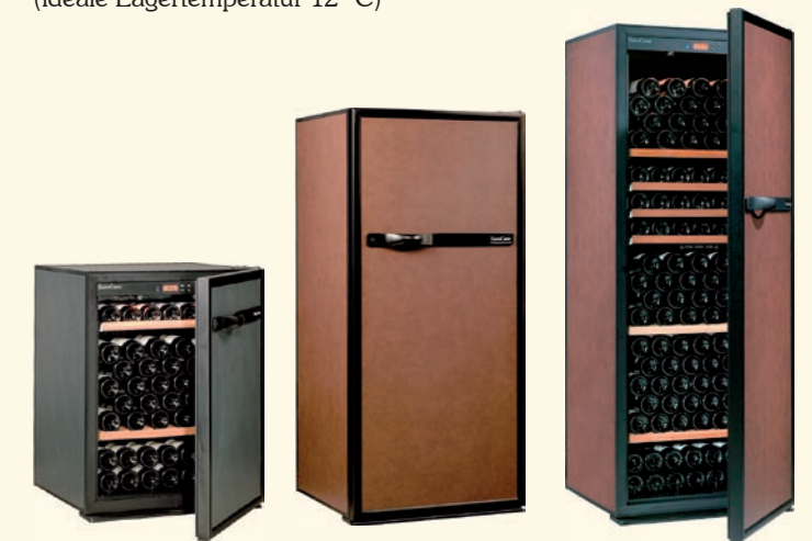
V - 083 1-Temp.-Weinklimaschrank Kapazität 92 Flaschen H 876 x B 654 x T 689 mm V - 183 1-Temp.-Weinklimaschrank Kapazität 183 Flaschen H 1444 x B 654 x T 689 mm V - 283 1-Temp.-Weinklimaschrank Kapazität 235 Flaschen H 1744 x B 654 x T 689 mm

Lagerung und Servieren von 5 °C – 21 °C (ideale Lagertemperatur 12 °C)