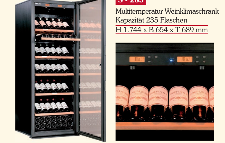
Multitemperatur Weinklimaschrank Kapazität 235 Flaschen H 1.744 x B 654 x T 689 mm