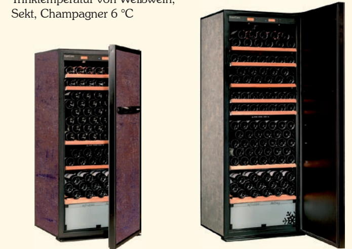
D - 183 2-Temperatur Weinklimaschrank Kapazität 174 Flaschen H 1.444 x B 654 x T 689 mm D - 283 2-Temperatur Weinklimaschrank Kapazität 233 Flaschen H 1.744 x B 654 x T 689 mm

Lagerung von Rot-/Weißwein 12 °C Trinktemperatur von Weißwein, Sekt, Champagner 6 °C