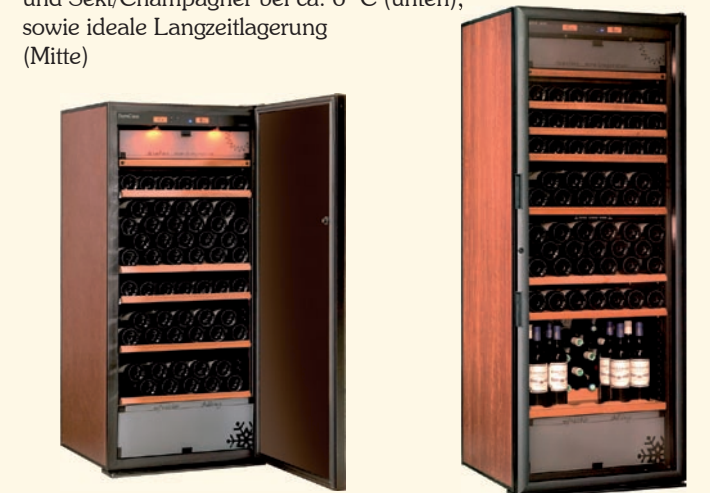
E - 183 3-Temperatur Weinklimaschrank Kapazität 169 Flaschen H 1.444 x B 654 x T 689 mm E - 283 3-Temperatur Weinklimaschrank Kapazität 211 Flaschen H 1.744 x B 654 x T 689 mm

Für die optimale Temperierung von Rotwein - ca. 17° C (oben) und Sekt/Champagner bei ca. 6° C (unten), sowie ideale Langzeitlagerung (Mitte)